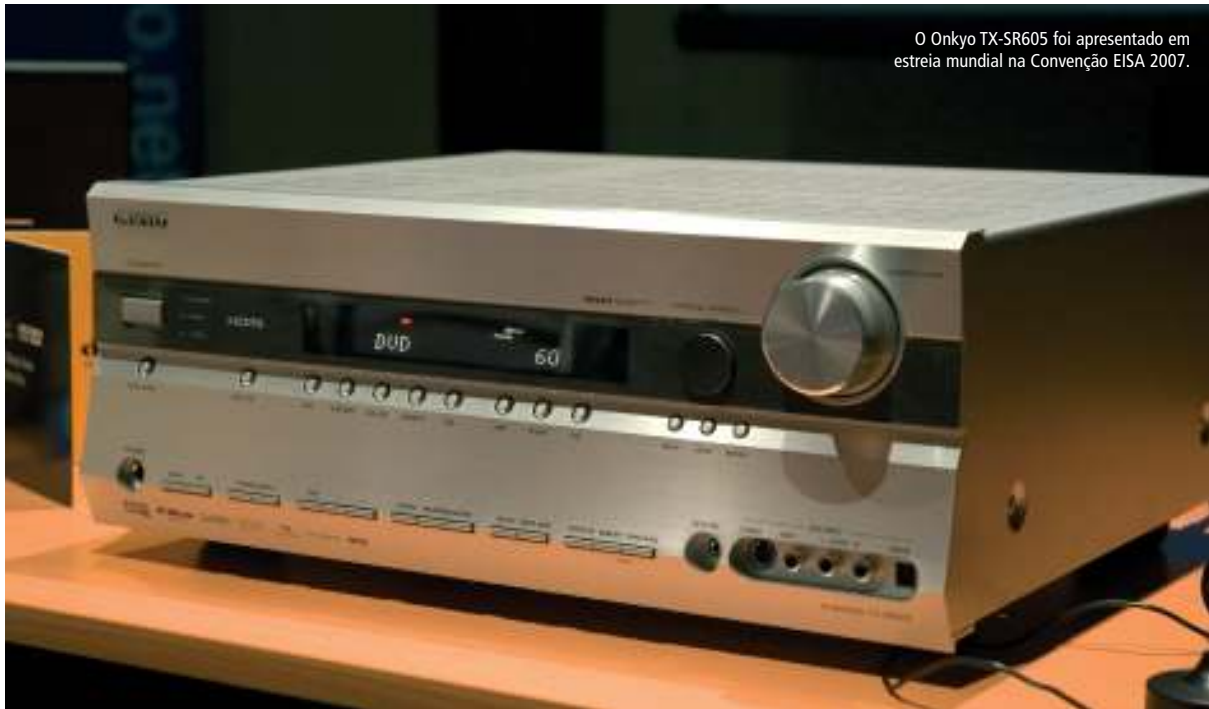
O Onkyo TX-SR605 foi apresentado em estreia mundial na Convenção EISA 2007.

Onkyo, pois é através dele que utilizamos quotidianamente o receptor.